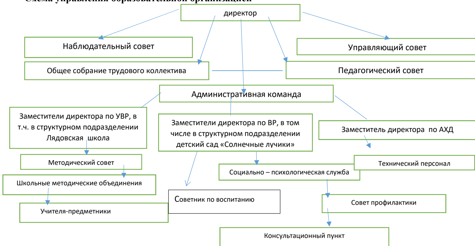
Схема управления образовательной организацией

По итогам 2023 года система управления школой оценивается как эффективная, позволяет учесть мнение всех участников образовательных отношений. Изменение системы управления в 2024 году не планируется.